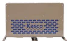
MAŁA OBUDOWA RAE 1 - 3

Wszystkie systemy charakteryzują się cichą pracą, zewnętrznymi wskaźnikami konserwacji, łatwo zdejmowanymi panelami oraz doskonale komponują się z otoczeniem.