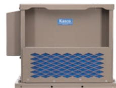
ŚREDNIA OBUDOWA RAE 4 - 6